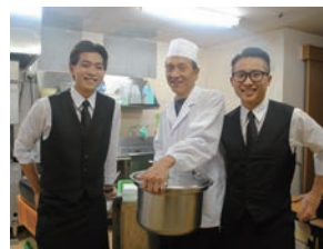
高山校ホテルコース..授業で学んだことを活かし、週末は旅館でアルバイトができます。