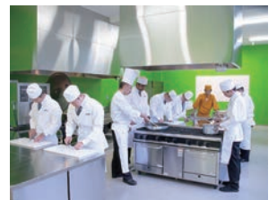
高山校調理学科..日本人だからといってそばは打てませんが、高山生は全員がそばを打ちます。