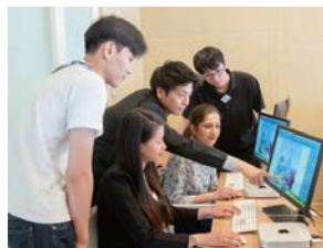
前橋校ITコース..Windows・Macを使い、基本から実践的な技術まで就職活動に役立つ技術を身につけます。